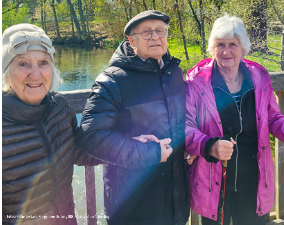
Fotos: Heike Destani; Pflegedienstleitung BRK-Sozialstation Schierling