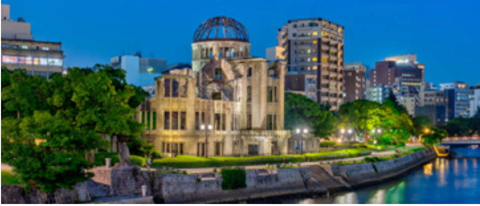
Das als Atomic Bomb Dome bekannte Gebäude in Hiroshima blieb nach dem Atombombenabwurf als Ruine zurück. Heute ist es Teil eines Friedensdenkmals.